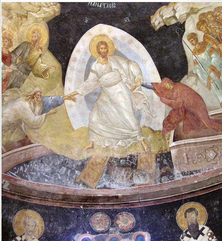
Anastasis, chiesa di San Salvatore, Chora (Turchia), inizi del secolo XIV.

Regina coeli, laetare, Quia quem meruisti portare, Resurrexit, sicut dixit, Ora pro nobis Deum.