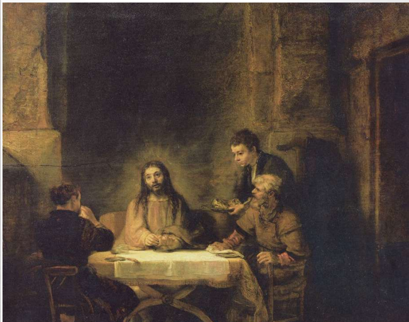
Cena in Emmaus (1648), Rembrandt (Musée du Louvre).

Regina coeli, laetare, Quia quem meruisti portare, Resurrexit, sicut dixit, Ora pro nobis Deum.