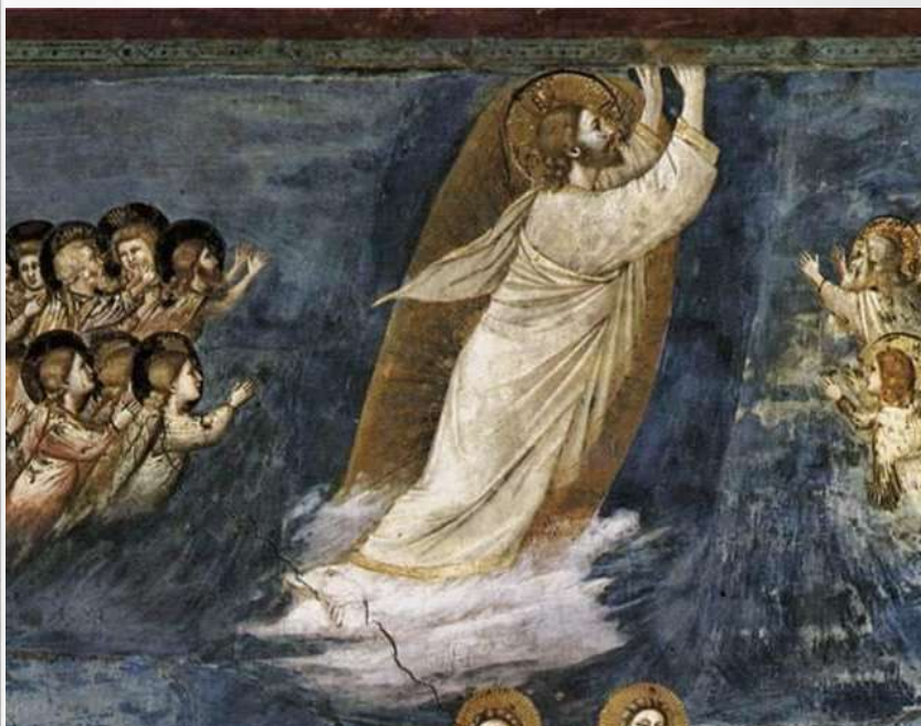
Duccio di Buoninsegna, L'Apparizione di Cristo sul monte della Galilea, Museo dell'Opera Metropolitana del Duomo (Siena).

Regina coeli, laetare, Quia quem meruisti portare, Resurrexit, sicut dixit, Ora pro nobis Deum.