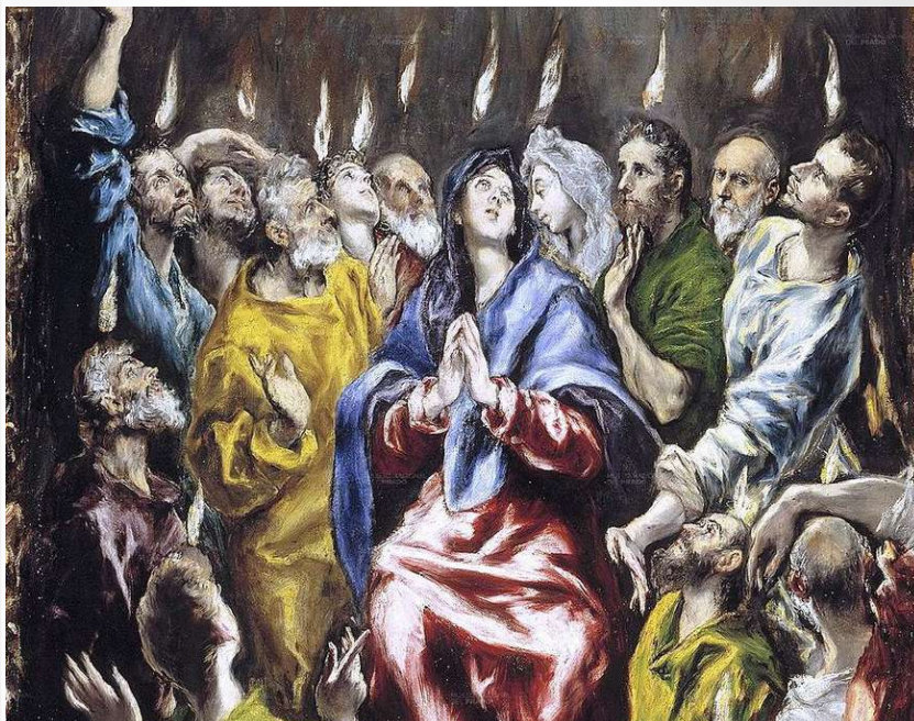
Pentecoste - El Greco (1597-1600), Museo Nacional del Prado, Madrid.

Regina coeli, laetare, Quia quem meruisti portare, Resurrexit, sicut dixit, Ora pro nobis Deum.