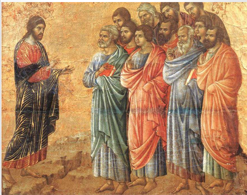
Duccio di Buoninsegna, L'Apparizione di Cristo sul monte della Galilea, Museo dell'Opera Metropolitana del Duomo (Siena).

Regina coeli, laetare, Quia quem meruisti portare, Resurrexit, sicut dixit, Ora pro nobis Deum.