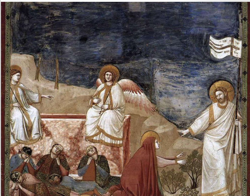
"Noli me tangere", Giotto, Cappella degli Scrovegni, Padova, 1303-1305.

Regina coeli, laetare, Quia quem meruisti portare, Resurrexit, sicut dixit, Ora pro nobis Deum.