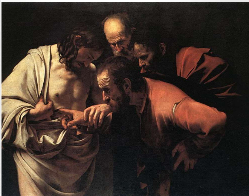
Incredulità di san Tommaso, Caravaggio (1600-1601), Bildergalerie de Potsdam.

Regina coeli, laetare, Quia quem meruisti portare, Resurrexit, sicut dixit, Ora pro nobis Deum.