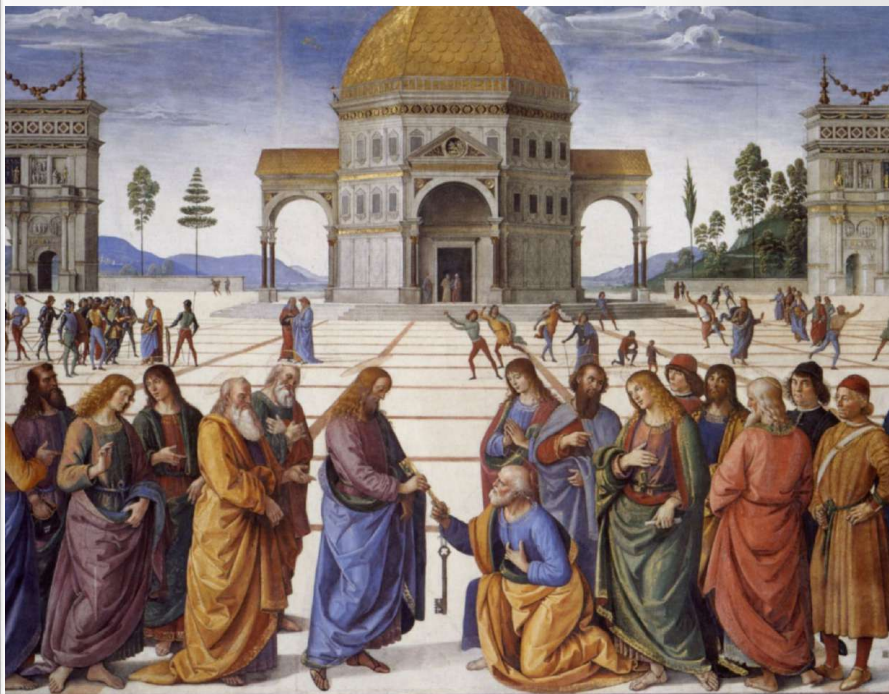
Consegna delle chiavi - Pietro Perugino (1481-1482), Cappella Sistina.

Regina coeli, laetare, Quia quem meruisti portare, Resurrexit, sicut dixit, Ora pro nobis Deum.