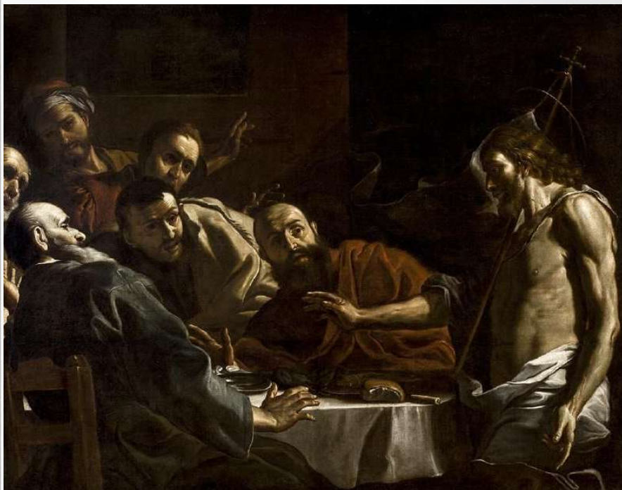
Cristo risorto nel Cenacolo, circa 1670. Mattia Pretti, Museo de Bellas Artes, Siviglia.

Regina coeli, laetare, Quia quem meruisti portare, Resurrexit, sicut dixit, Ora pro nobis Deum.