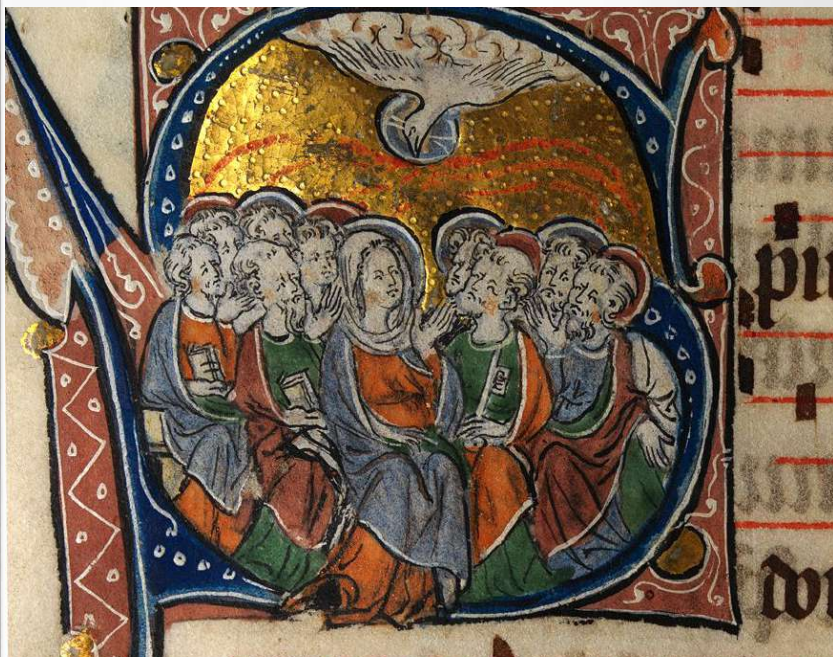
Pentecoste, Messale seculo XIV, in pergamina (Anglia orientale).

Regina coeli, laetare, Quia quem meruisti portare, Resurrexit, sicut dixit, Ora pro nobis Deum.