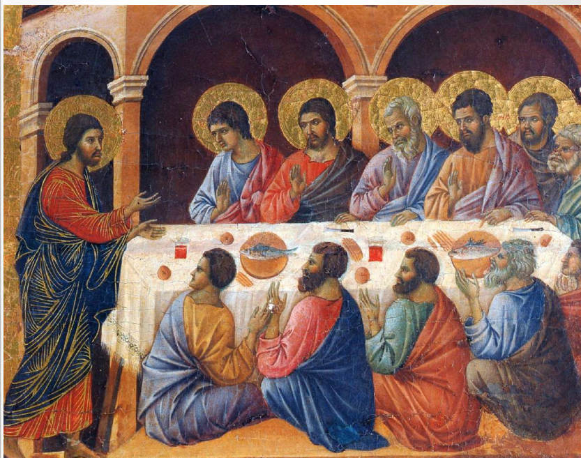
L'Apparizione di Cristo durante la cena degli apostoli. Duccio di Buoninsegna (1308-1311). Museo dell'Opera Metropolitana del Duomo (Siena).

Regina coeli, laetare, Quia quem meruisti portare, Resurrexit, sicut dixit, Ora pro nobis Deum.