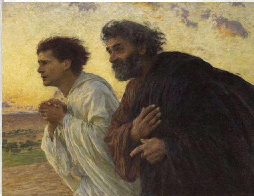
Eugène Burnand. La corsa dei discepoli Pietro a Giovanni al sepolcro (1898)

Regina coeli, laetare, Quia quem meruisti portare, Resurrexit, sicut dixit, Ora pro nobis Deum.