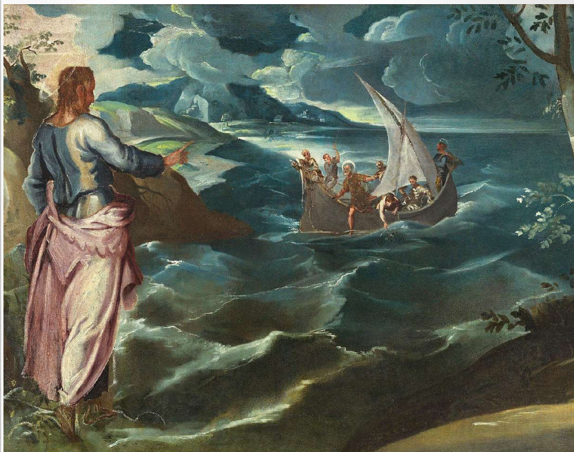
Cristo sul mare di Galilea Tintoretto (1575-1580), National Gallery of Art, Washington.

Regina coeli, laetare, Quia quem meruisti portare, Resurrexit, sicut dixit, Ora pro nobis Deum.