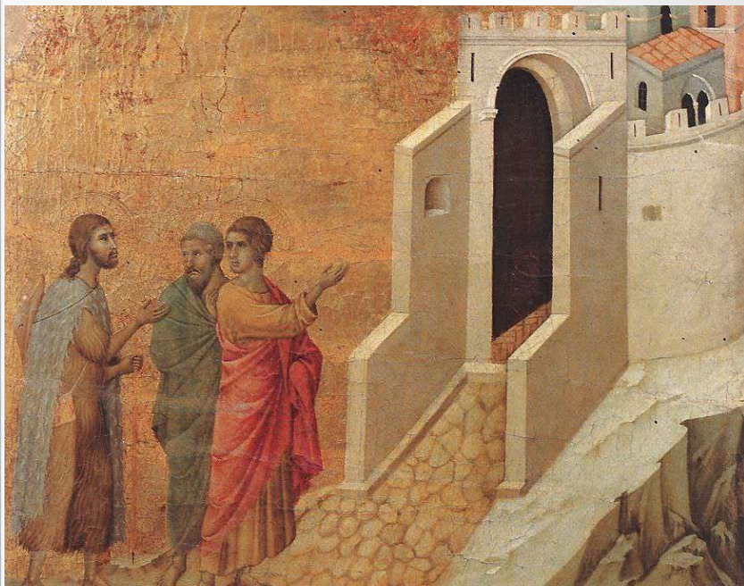
Duccio di Buoninsegna, Cristo ad Emmaus, (1308- 1311), Museo dell'Opera Metropolitana del Duomo (Siena).

Regina coeli, laetare, Quia quem meruisti portare, Resurrexit, sicut dixit, Ora pro nobis Deum.